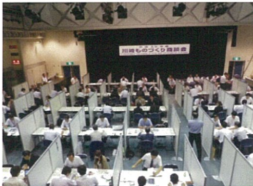
昨年度 川崎ものづくり商談会の様子

この度、新たな取引先をお探しの受注企業の皆様を対象に、本商談会への参加企業を募集することいたしましたので、お知らせします。