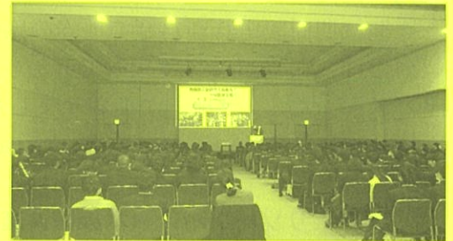
講演を聴く生徒の皆さん

そして講演の後、テクニカルショウヨコハマを見学し、見聞を広めてもらいました。生徒の皆さんには、経営者の声が生で届き、将来の進みたい道を考えるよい機会になったのではないのでしょうか。