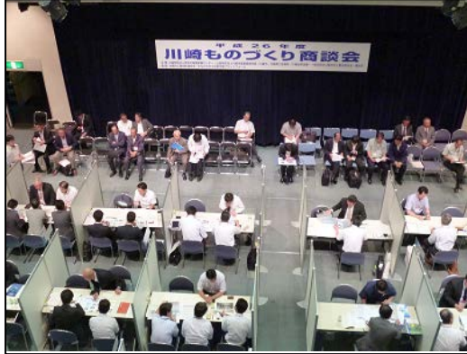
昨年度 川崎ものづくり商談会の様子

この度、新たな取引先をお探しの発注企業の皆様を対象に、本商談会への参加企業を募集することいたしましたので、お知らせします。