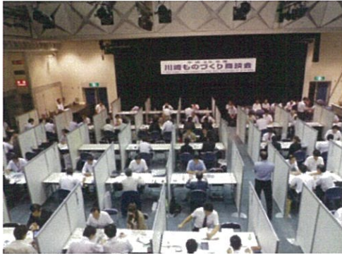
昨年度 川崎ものづくり商談会の様子

この度、新たな取引先をお探しの発注企業の皆様を対象に、本商談会への参加企業を募集することといたしましたので、お知らせします。