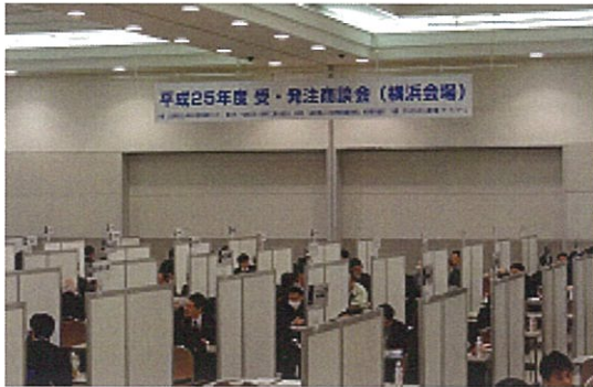
昨年度 受・発注商談会（横浜会場）の様子

この度、新たな取引先をお探しの発注企業の皆様を対象に、本商談会への参加企業を募集することといたしましたので、お知らせします。