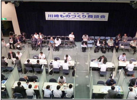
昨年度 川崎ものづくり商談会の様子

この度、新たな取引先をお探しの受注企業の皆様を対象に、本商談会への参加企業を募集することといたしましたので、お知らせします。